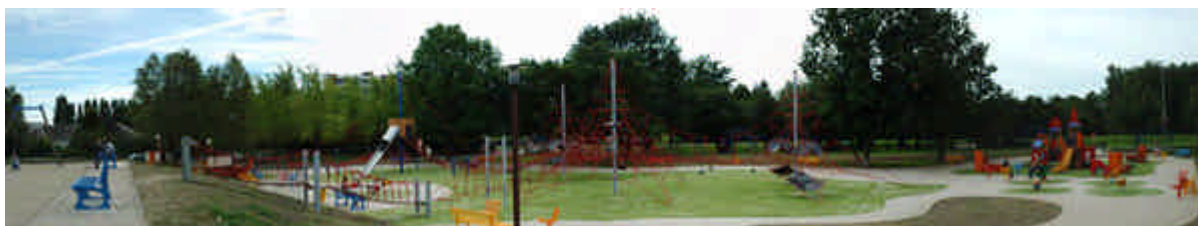
Aire de jeux Jacques Cartier : 1 000 m 2 équipés de jeux pour tous les âges, également avec des jeux de plein-pied accessibles aux handicapés moteurs

Dans la catégorie des communes de 10.000 à 50.000 habitants, le jury a également distingué la ville de NEVERS (Nièvre), pour sa politique d'aménagement très structurée et son travail d'évaluation de la fréquentation et de la perception des aires de jeux par le biais d'une enquête effectuée auprès des enfants et de leurs parents. Cette approche apparaît à la fois innovante et très utile pour identifier les besoins, identifier les freins à la fréquentation des équipements et y remédier et faire évoluer le parc.