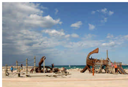
Plages du Prado