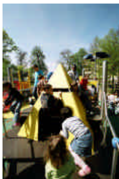
Aire de jeux Parc Roger Salengro : le rendez-vous des enfants de toute la ville

Dans la catégorie des communes de 10.000 à 50.000 habitants, le jury a également distingué la ville de NEVERS (Nièvre), pour sa politique d'aménagement très structurée et son travail d'évaluation de la fréquentation et de la perception des aires de jeux par le biais d'une enquête effectuée auprès des enfants et de leurs parents. Cette approche apparaît à la fois innovante et très utile pour identifier les besoins, identifier les freins à la fréquentation des équipements et y remédier et faire évoluer le parc.