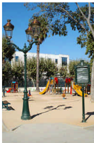
Jardin Elisa : une aire de jeux de quartier au cœur de la ville

Le Jury a également distingué la ville de MARSEILLE , pour la remarquable diversité des jeux offerts aux enfants de la cité phocéenne, que ce soit en termes de fonctions ludiques ou d'esthétique, avec une ouverture aux styles les plus divers, une recherche constante d'intégration dans l'environnement et de cohérence avec les fonctions dévolues à l'espace public où ils sont installés.