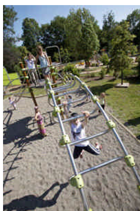
Auzon jouer – Trois zones de Jeux sur une coulée verte