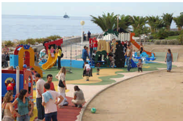
Aire de jeux de la Place Miot : lieu de convergence de tous les quartiers de la ville