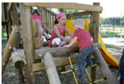
1, 2, 3... Pandières – 1800 m 2 pour le jeu et la détente dans un quartier en plein développement