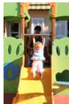
En crèches et maternelles : des aire de jeux liées aux projets pédagogiques