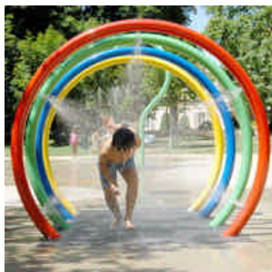
Parc Billoux : jeux d'eau

Le Jury a également distingué la ville de MARSEILLE , pour la remarquable diversité des jeux offerts aux enfants de la cité phocéenne, que ce soit en termes de fonctions ludiques ou d'esthétique, avec une ouverture aux styles les plus divers, une recherche constante d'intégration dans l'environnement et de cohérence avec les fonctions dévolues à l'espace public où ils sont installés.