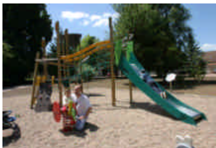
Aires de jeux de proximité : utilisées quotidiennement, surtout après l'école