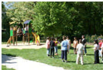
Groupe scolaire Louis Aragon

Le Jury a également souhaité souligner le grand intérêt des dossiers présentés par les deux autres communes finalistes dans cette catégorie :